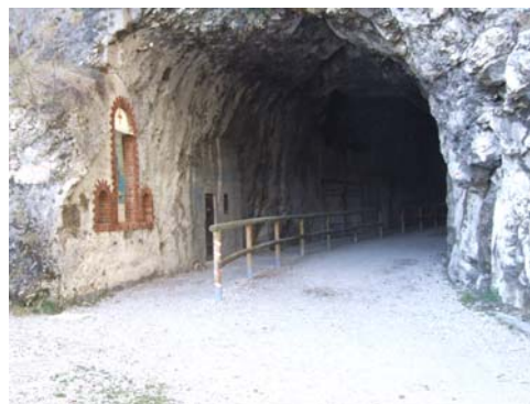
Inizio Strada con la Madonnina